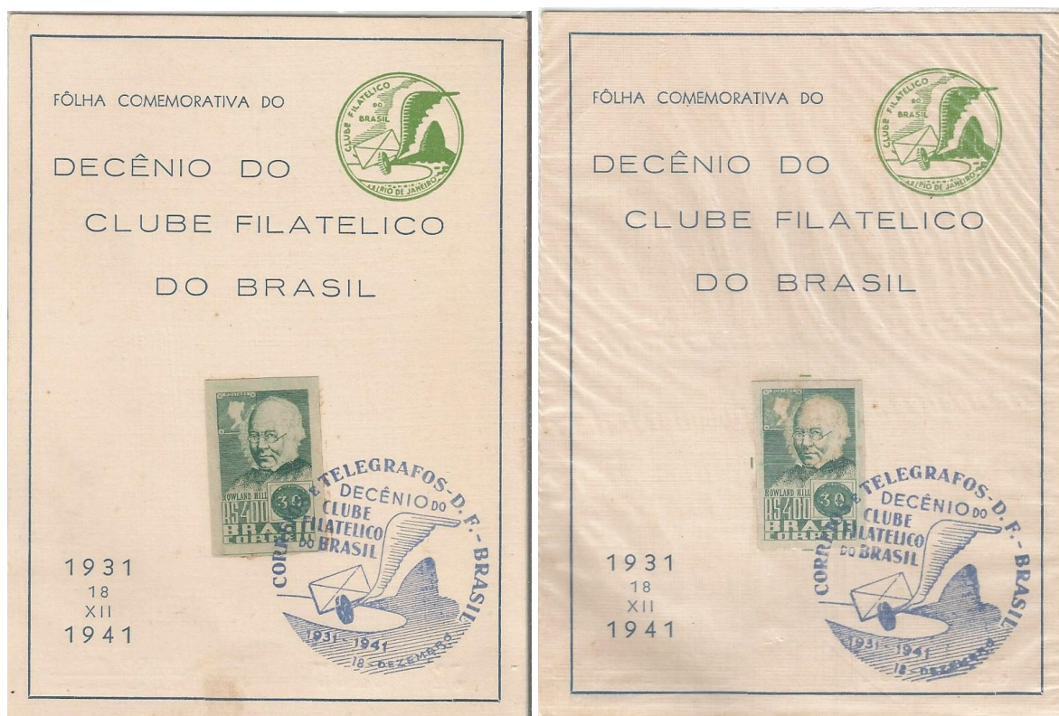
DUAS FOLHINHAS DO CLUBE FILATÉLICO COM O SELO DO SIR ROWLAND HILL E O CARIMBO DO CLUBE