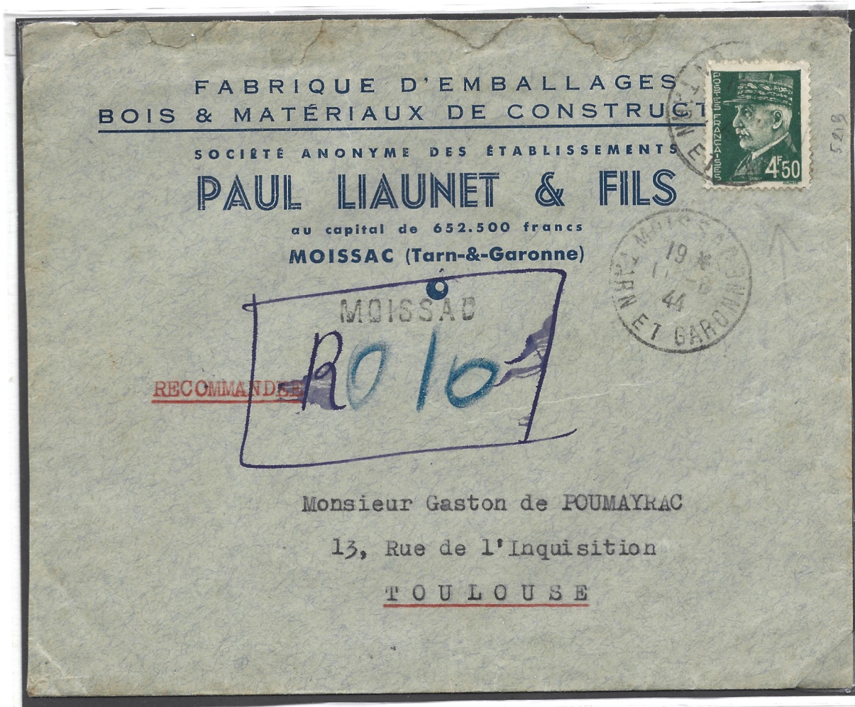
Carta expedida de Moissac (Tarn & Garone) para Toulouse em 19/11/1944 – com chegada

Nos termos do armistício assinado, o norte da França, incluindo Paris, foi designado Zona de Ocupação Francesa, enquanto o sul foi considerado Zona Livre, onde o Marechal Pétain organizou a França de Vichy. Nos termos do armistício o norte da França, incluindo Paris, foi designado Zona de Ocupação Francesa, enquanto o sul foi considerado Zona Livre, onde o Marechal Pétain organizou a França de Vichy.