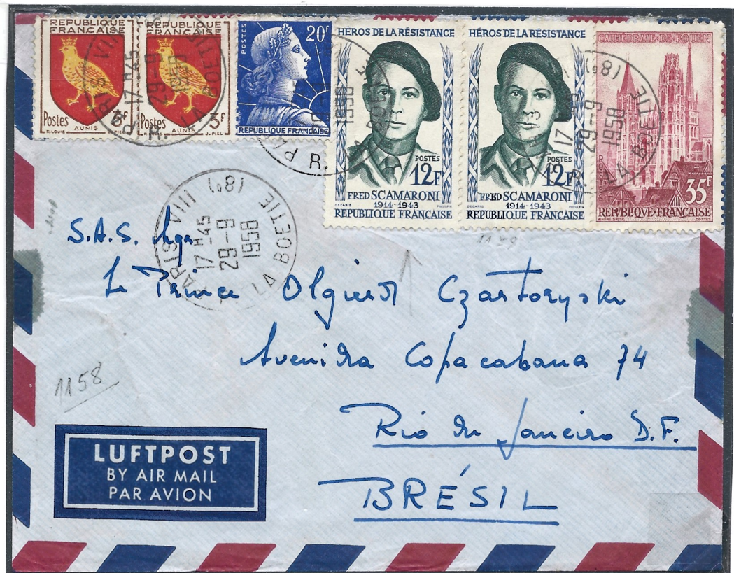
Envelope circulado se Paris para o Rio de Janeiro / Brasil – 29/09/1958 com selo de Herói da Resistência

Jean Moulin foi encarregado pelo General Charles de Gaulle de unificar o movimento de Resistência contra a ocupação alemã na França. Morreu torturado; Honoré D'Estienne era oficial da Marinha da França e foi considerado o primeiro mártir da França Livre; Pierre Brossolette considerado grande figura da política e da cultura francesa está no Panteão dos Heróis. Era um jornalista considerado importante ativista da Resistência. Detido e torturado pela Gestapo, suicidou-se para evitar falar sob tortura.