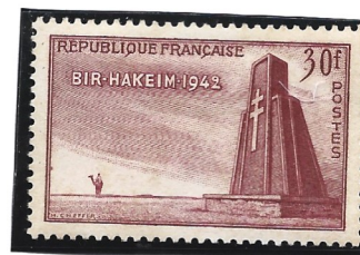
Ponte Bir-Hakeim – sobre o Sena. Monumento à Resistência