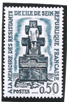
Memória aos Resistente do Seine