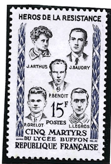
Heróis e mártires da Resistência.