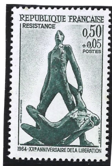
1964 – XX aniversário da Liberação da França