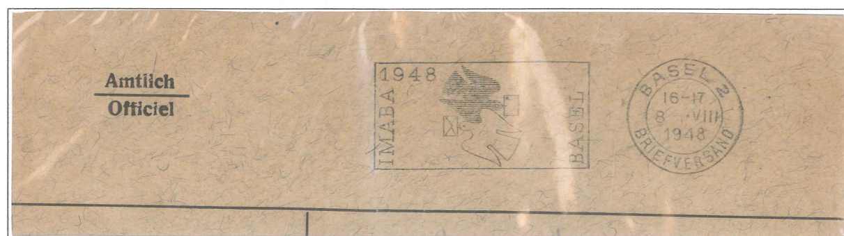
Suiza 1948: Matasello Mecánico, con valor de porte local.