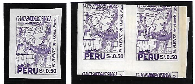
Estampilla autoadhesiva tipo y estampillas con mal corte del Perú del 11/03/1994 impresas por la Empresa Editora PIEDUL SRL-Perú, dedicada a un puente Inca.