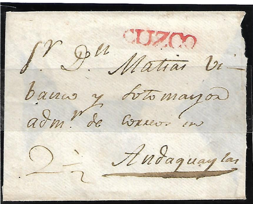
Sobre pre-filatélico "CUZCO" en color rojo de 1833

Manco Inca Yupanqui o simplemente Manco Inca fue nombrado Inca por Francisco Pizarro en 1533