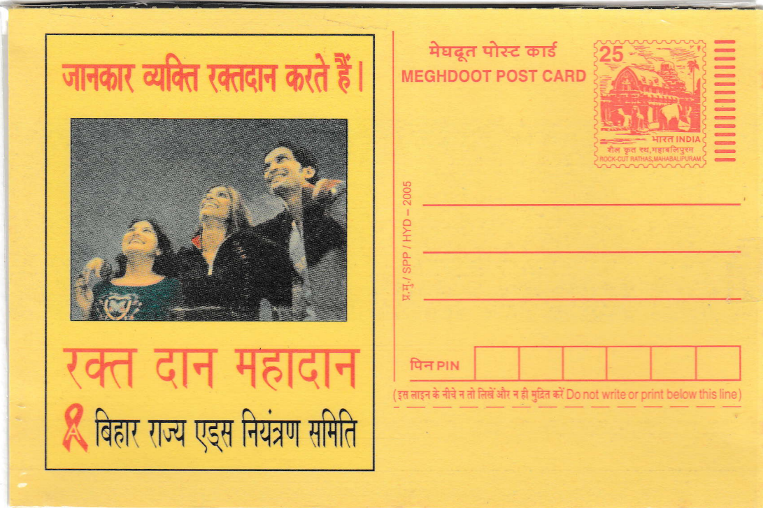
6.1 AWARENESS ON AIDS. RELEASED IN THE YEAR 2005. LANGUAGE HINDI.