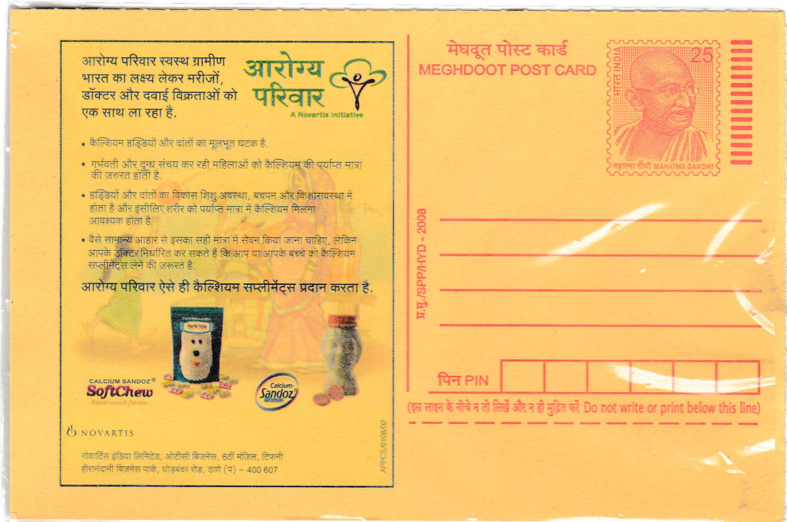
12.1 AWARENESS ON CALCIUM DEFICIENCY. RELEASED IN THE YEAR 2008. LANGUAGE HINDI.